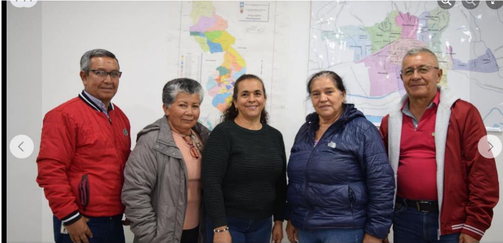
Toma de juramento